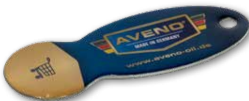
EINKAUFS- WAGEN- AUSLÖSER SHOPPING TROLLEY TRIGGER