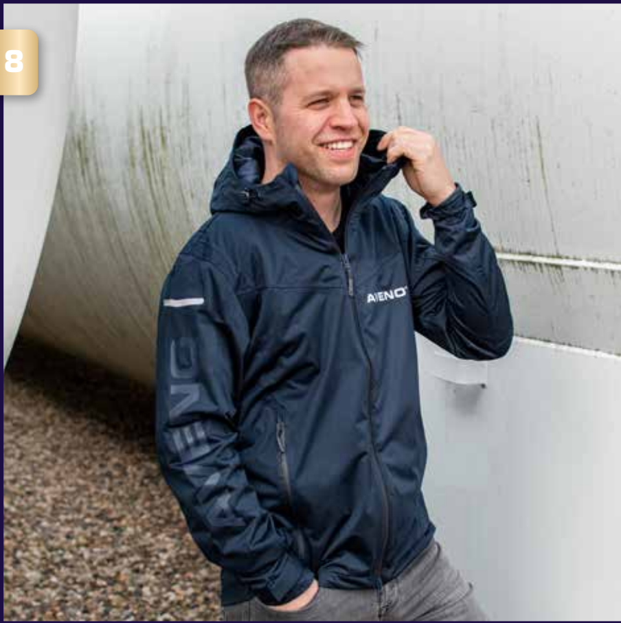
ALLWETTER- SOFTSHELL-JACKE ALL-WEATHER SOFTSHELL JACKET