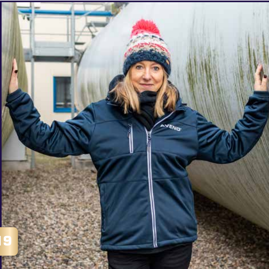
SOFTSHELL-JACKE SOFTSHELL JACKET